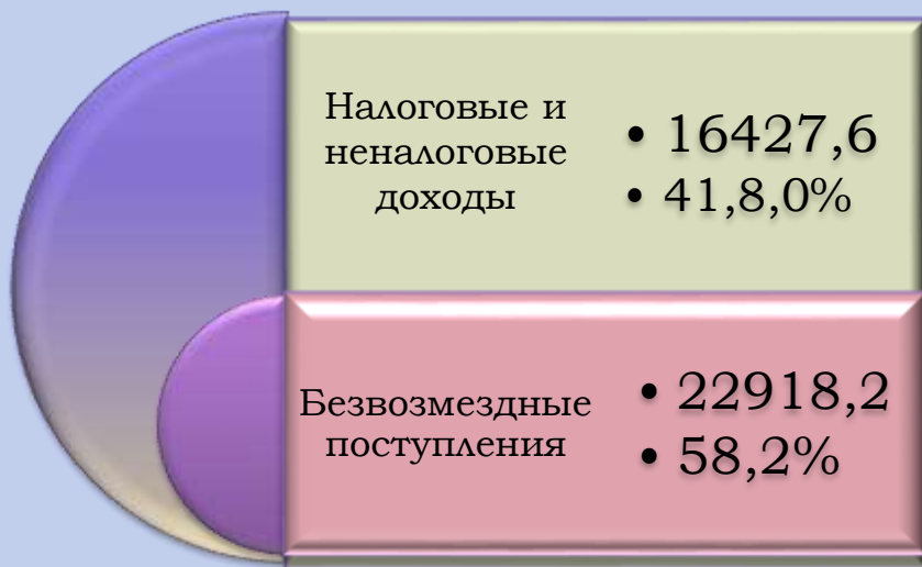
Доходы бюджета, тыс. рублей